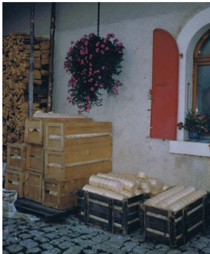
Au mois de septembre, alors que la famille n'est pas encore redescendue de l'alpage, on monte déjà des boîtes au Pré-Jentet. Les caisses jaunes pour Gaston Rochat, les noires pour la laiterie Magnenat du Séchey.